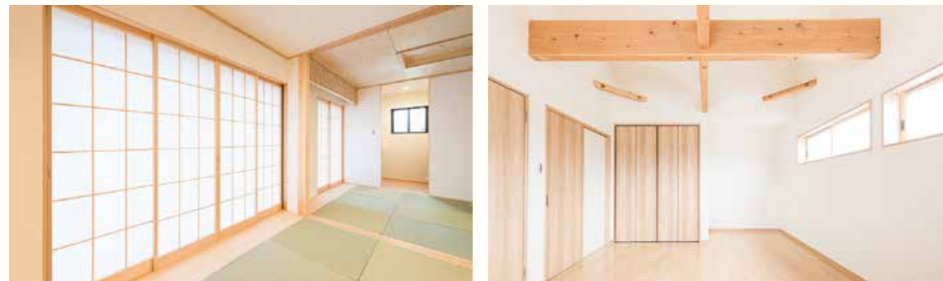
畳敷きで開放的な空間。窓辺に並ぶ和紙張りの障子が独特の柔らかい光を届けます。梁の太い2階は、ハンモックなど吊るして楽しく開放的に。